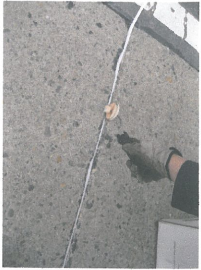
バックロットの挿入