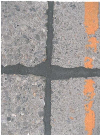
クロス部分のシール