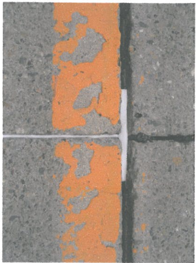
バックロット挿入後