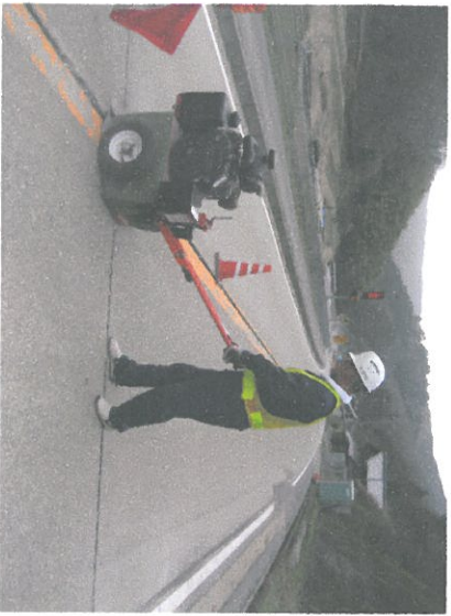
旧シール材の除去