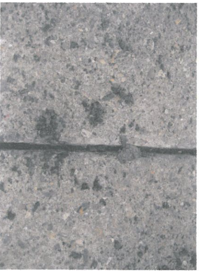
旧シール材の除去