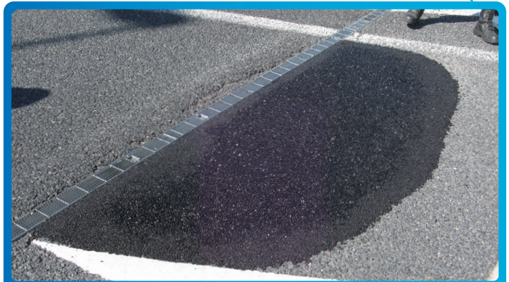
④ 補修完成 補修後でも直ぐに車両が通過してもタイヤに付着せず、車両転圧することで安定します