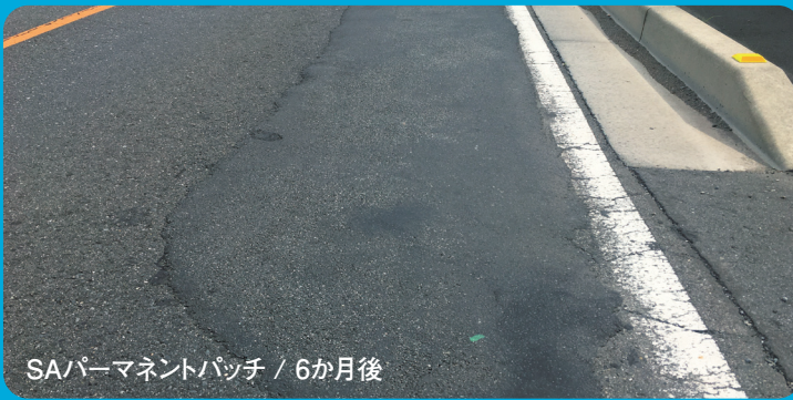
SAパーマネントパッチ / 6か月後