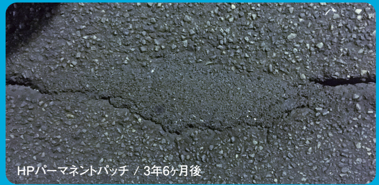
HPパーマネントパッチ / 3年6ヶ月後