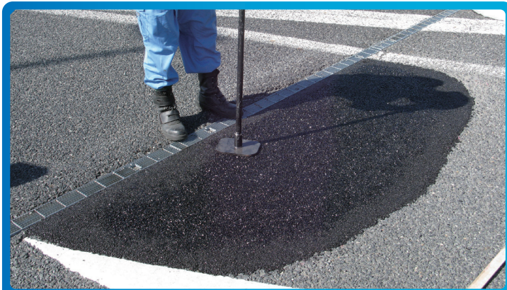
③ 材料敷き均し 余盛をしスコップ等で敷き均し平らにしてください