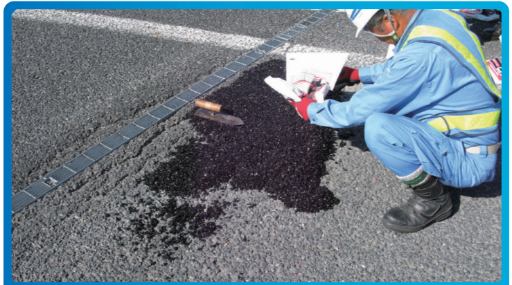
② 材料投入 パーマネントパッチを充填してください