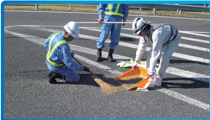
① 清掃作業 損傷箇所のゴミを除去します