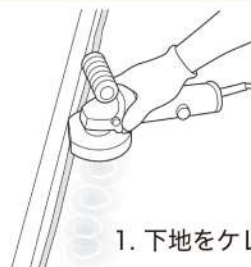
1. 下地をケレン作業