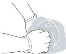
4. 30秒間よく混ぜます