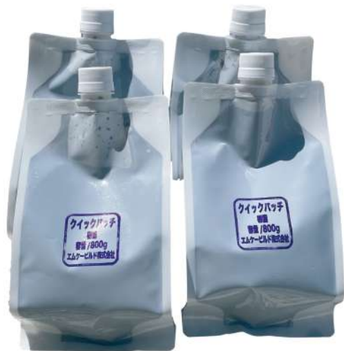
クイックパッチ樹脂 800g x 4個 粉末 4Kg x 4袋