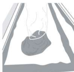
5. クイックパッチを施工面に投入します