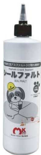
シールファルト 500g/本