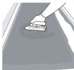
6. コテで敷き均します